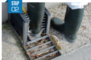
Spoel met water