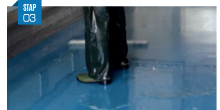
Spoel met water Spoel met water (hogedruk reiniging (50 – 150 bar en 12 – 30 Ls/min) en laat drogen.