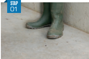
Droge reiniging (borstel) Verwijder alle mest.