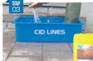
Ontsmet Concentratie: 0,5 – 1 %.