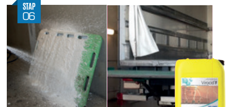
Het materiaal en de laadbrug Al het materiaal die door bestuurders wordt gebruikt voor het laden of lossen van dieren (zoals bijvoorbeeld drijfboards) moet aan het einde van de vuile weg van het bedrijf gereinigd en ontsmet worden. Op deze locatie moeten alle nodige voorzieningen voor een reiniging en ontsmetting aanwezig zijn. De laadbrug van de vrachtwagen mag hierbij zeker niet vergeten worden. Concentratie: 0,25 - 0,5%.

Gebruik signalisatieborden om het bewustzijn te creëren voor werknemers en bezoekers!