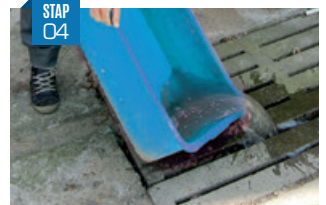
Vervang Vervang de oplossing regelmatig: 2 tot 3 keer/week.