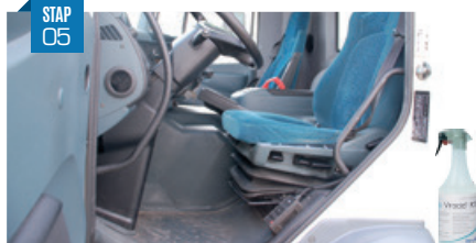
Cabine De cabine moet te allen tijde schoon gehouden worden. Afzonderlijke, propere kledij en schoeisel worden gebruikt bij het laden/lossen en deze worden meegenomen bij het terugkeren naar de cabine. De vloermatten moeten elke dag grondig gereinigd en ontsmet worden. De cabine moet minstens één keer per week volledig gestofzuigd en gereinigd worden.