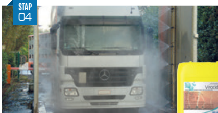
Ontsmetting (spray of schuim) Ontsmet alle oppervlakten aan binnen- en buitenkant met het correcte ontsmettingsmiddel. Werk van boven naar beneden en schenk extra aandacht aan de wielen en eventuele scheuren. Vergeet de onderkant van het voertuig niet. Concentratie: 0,25 - 0,5%.