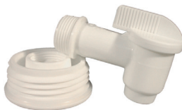
Kraan vat - 2 duim 600.900.00010