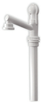
Pomp vat 210 L ezi-action 600.900.00013