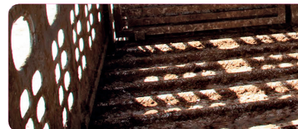
STAP 2 Droge reiniging na het uitladen Verwijder het grof vuil.