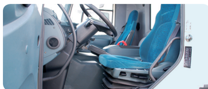
STAP 7 Reinigen en ontsmetten van de cabine Reinig pedalen, tapijten, stuur, trapjes en zetels met een borstel en ontsmet