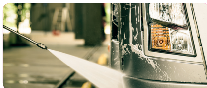
STAP 4 Spoelen met water Spoel met water onder hoge druk (50-150 bar en 12-30 liter per min)