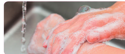
STAP 8 Persoonlijke hygiëne • was en ontsmet de handen • ontsmet de laarzen • zorg voor aparte kledij voor het (ont)laden en het rijden met de vrachtwagen