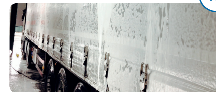
STAP 3 Schuimreiniging Exterieur, interieur, wielen, materiaal, laadbrug.