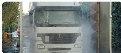
STAP 1 Betreden van het domein Desinfectieboog of wielmatten.