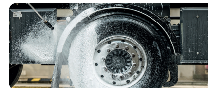
STAP 6 Ontsmet (spray of schuim) Exterieur, interieur, wielen, materiaal, laadbrug. Laat drogen