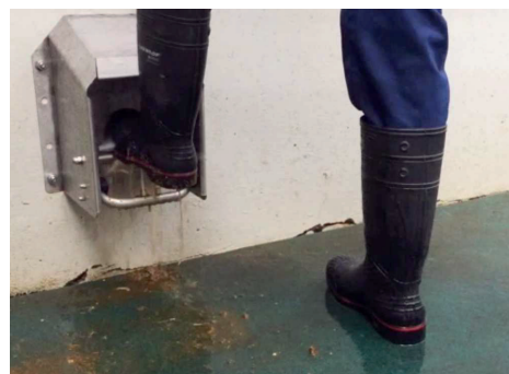
Reinigt zowel onderzijde, neus en zijkant, voor een schoon resultaat.