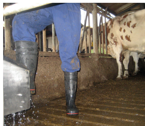
Plaatsing boven de roosters: vuil blijft zo achter in stal. Voor een schone voergang.